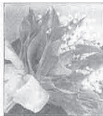
Le muguet porte bonheur

Le muguet symbolise le retour du bonheur. Comme il fleurit à l'apogée du printemps, le muguet représente le retour de la belle saison et des jours heureux. Dans le langage des fleurs, le muguet signifie retour du bonheur; de ce fait, offrir du