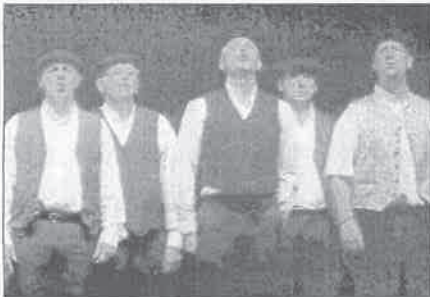
Evocation des voyages et des concours d'orphéons