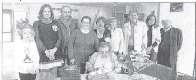
La centenaire, sa famille et les élus

petits enfants. Gâteau, fleurs et musique ont été ses cadeaux d'anniversaire. Un heureux anniversaire entourée de sa famille et de ceux qu'elle côtoie quotidiennement : les soignants et les pensionnaires du foyer.